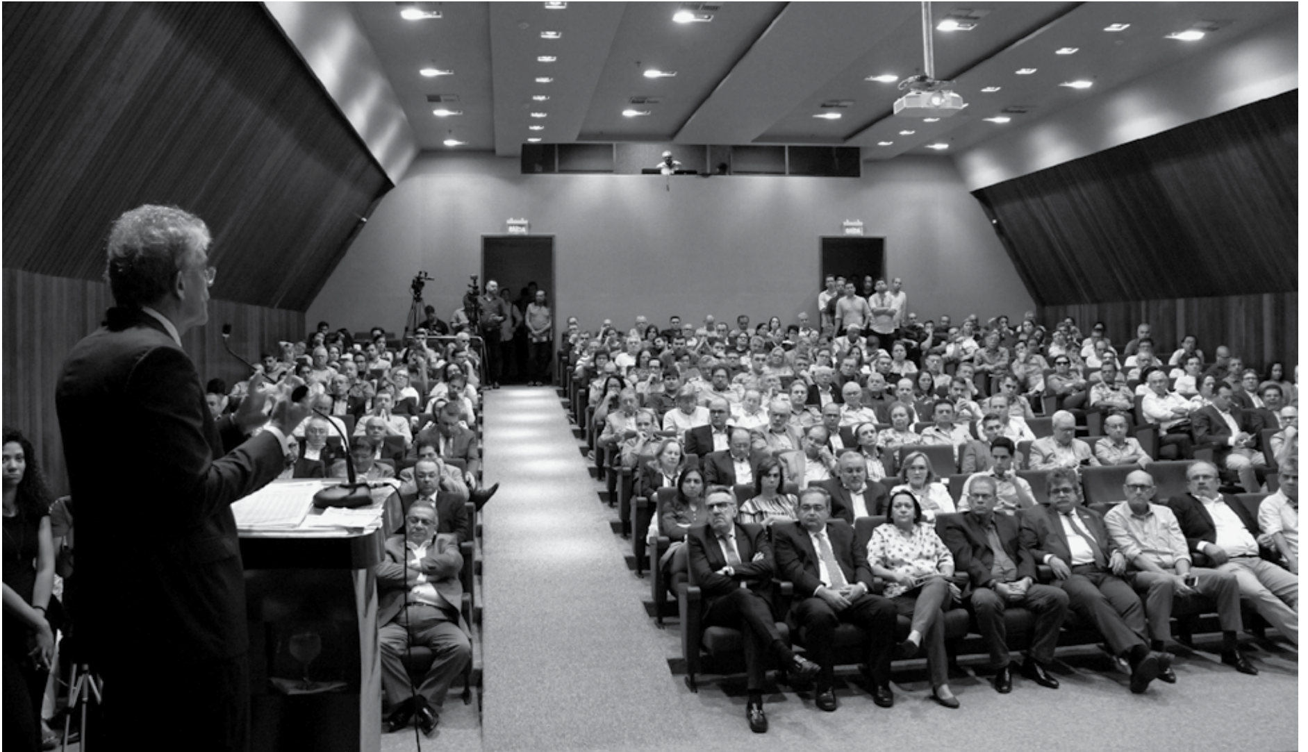
O governador destacou que a experiência da Paraíba pressupõe a responsabilidade fiscal, econômica, social e democrática, que garantiu aumento significativo na capacidade de investimento do Estado

Em sua palestra, o governador Ricardo Coutinho agradeceu a oportunidade de participar do evento, falou sobre medidas adotadas para que o Estado evoluísse e comentou que a experiência da Paraíba pressupõe a responsabilidade fiscal, econômica, social e democrática. "Ao mesmo tempo, houve um aumento significativo na capacidade de investimento do Estado, porque tiramos da atividade meio e colocamos para a ponta. Essa não é uma operação fácil, porém fizemos. Tiramos muito de custeio, da atividade meio para botar em investimentos, com isso a Paraíba melhorou todos os seus indicadores e a tendência é que este processo continue", afirmou.