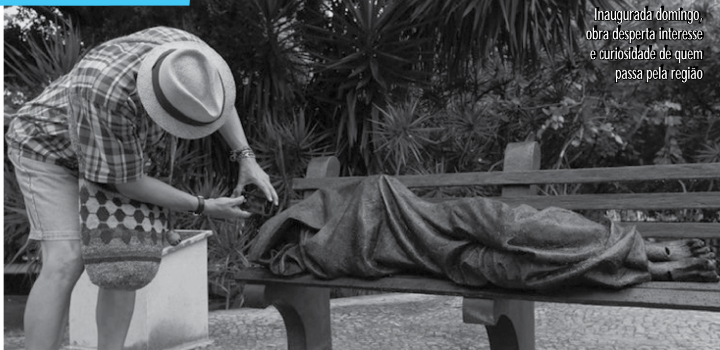
Inaugurada domingo, obra desperta interesse e curiosidade de quem passa pela região