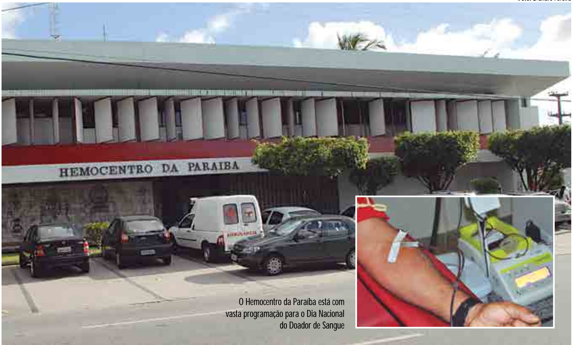
O Hemocentro da Paraíba está com vasta programação para o Dia Nacional do Doador de Sangue

Já no dia 22, será realizada uma Coleta Externa de Sangue na cidade de Itabaiana. A atividade vai acontecer na Escola Politécnica de Saúde Cristo Rei, localizada na Rua Cônego Tranquilino Nº 121, Centro, das 9 às 16h.