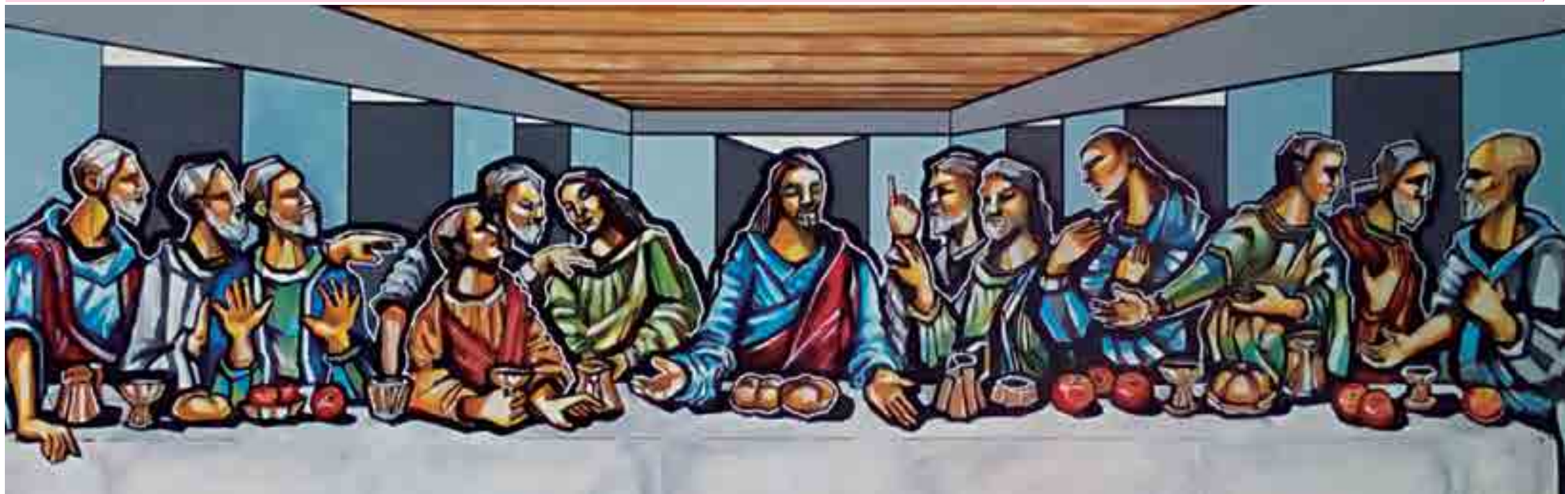
Obras que integram a exposição aborda vários temas, incluindo o sacro, a exemplo da que retrata a Santa Ceia que Jesus Cristo realiza com seus 12 apóstolos. Cores vibrantes e contornos bem definidos caracterizam trabalhos