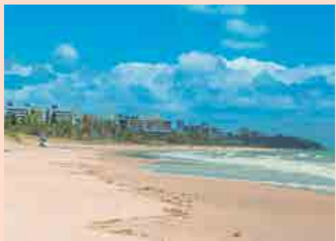
Municípios é um dos 25 "Destinos secretos preferidos dos brasileiros"