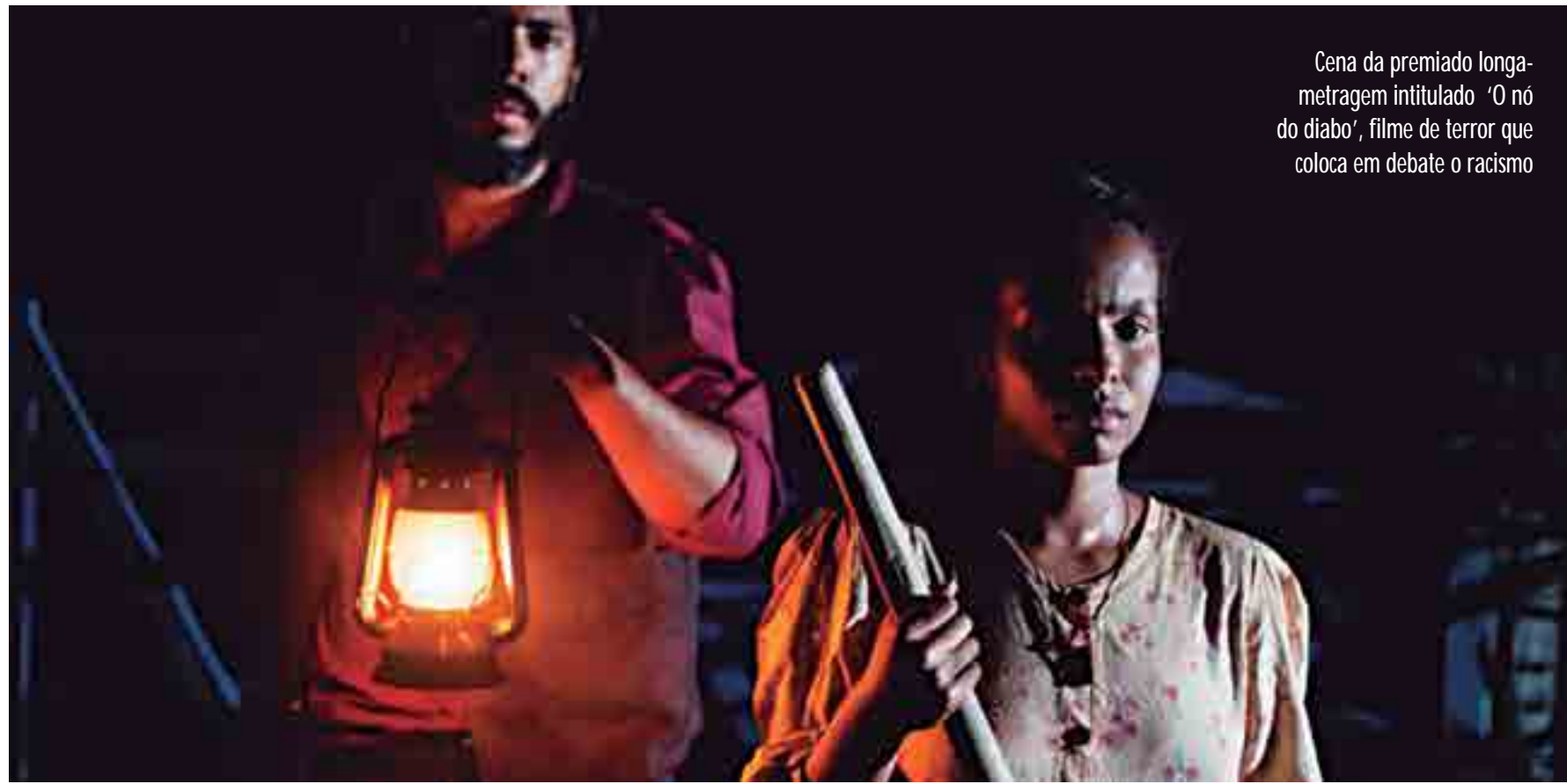
Cena da premiado longa-metragem intitulado 'O nó do diabo', filme de terror que coloca em debate o racismo