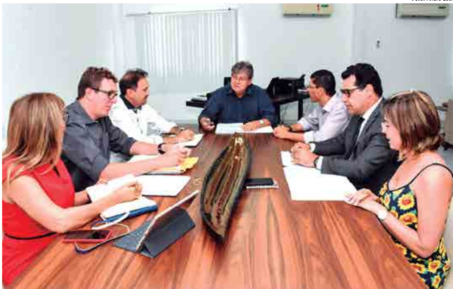
João Azevêdo também informou que a CTG está elaborando um levantamento sobre os trabalhos desenvolvidos em cada secretaria do Estado

“O propósito maior é estudar as possíveis reformas que podem ser feitas no sentido de adequar a proposta de governo de João Azevêdo. Nós estamos pensando em ações que visem trazer mais eficiência e modernização à administração pública. O nosso objetivo é chegar no dia 2 de janeiro com todas as ações prontas para começar