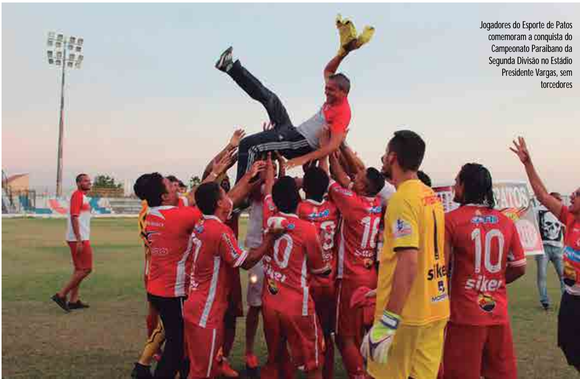
Jogadores do Esporte de Patos comemoram a conquista do Campeonato Paraibano da Segunda Divisão no Estádio Presidente Vargas, sem torcedores