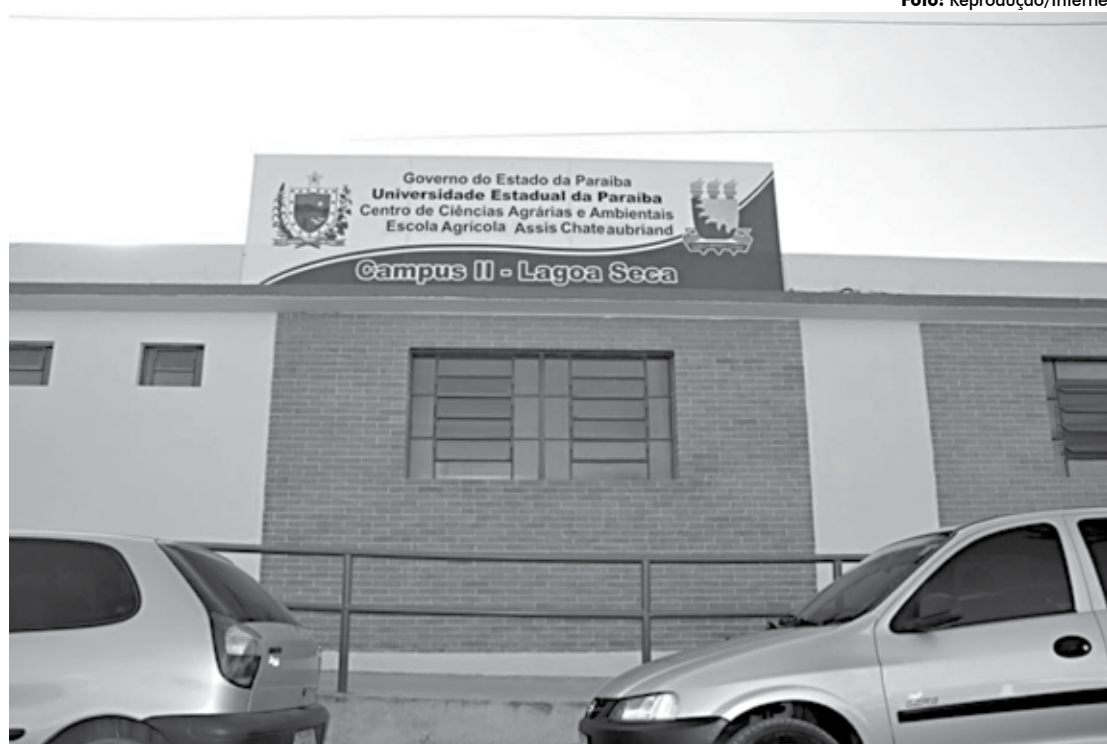
A Escola Agrícola Assis Chateaubriand, pertencente ao Centro de Ciências Agrárias e Ambientais, Campus II da UEPB

Os cursos são destinados aos alunos que tenham concluído ou estejam cursando o Ensino Médio. Para se inscrever, o aluno deve apresentar uma declaração de que é concluinte ou concluiu o Ensino Médio, além dos documentos pessoais (cópias do RG, CPF, com-