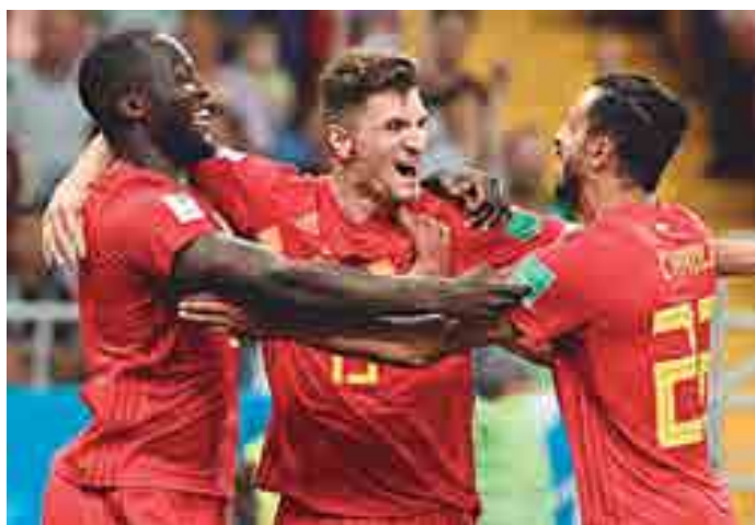
Os belgas abrem 2 a 0, mas acabaram levando cinco gols da Suíça