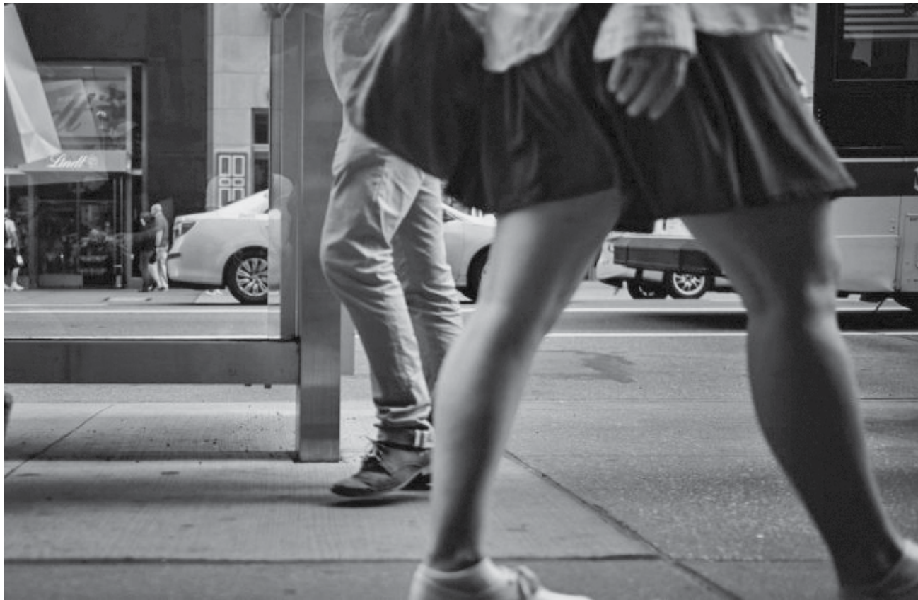
A saúde das pessoas que caminham mais rápido piora de forma mais lenta do que a das pessoas que andam mais devagar