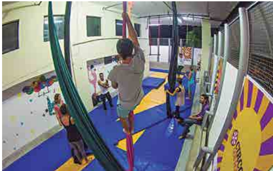
Alunos prometem transformar o palco num picadeiro, onde cenas vão mesclar o passado com o presente